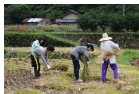
中山を元気にし隊