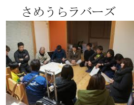
さめうらラバーズ