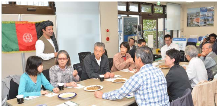
「グローバルカフェへの誘い ～東海大学が開く魅惑の世界～ (アフガニスタン)」