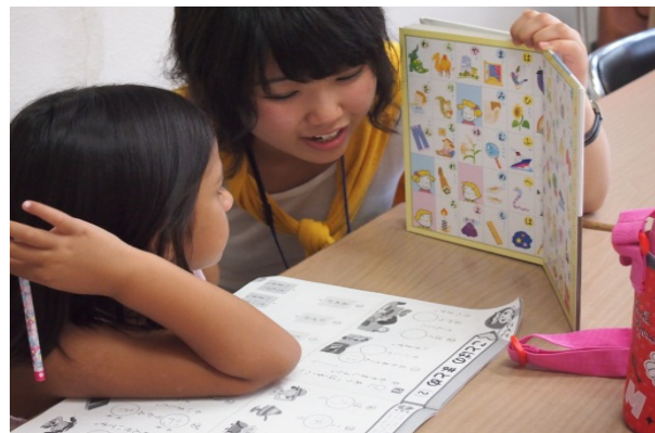
Tokai International Communication Club (TICC)