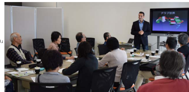
10/18開催 「アラブ世界 そこが知りたい (グローバルカフェへの誘い ～東海大学が開く魅惑の世界～)」