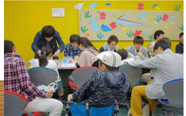
サイエンスコミュニケーター