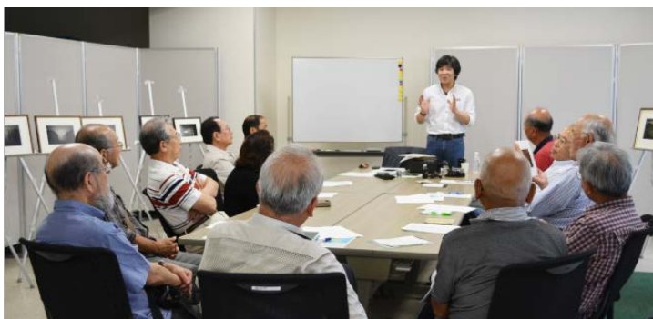
「入門!オールドレンズで楽しむ デジタルカメラ」