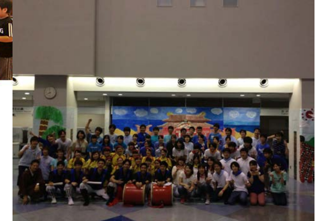
病院ボランティアプロジェクト