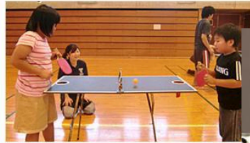
スポーツ社会貢献プロジェクト