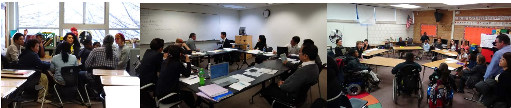
平成26年11月に実施した米国・Augsburg CollegeにおけるPA研修の様様

平成29年度に、PA型教育のための基礎科目として、「シティズンシップ」「ボランティア」「地域理解」の3科目を全学必修科目として開講予定。また、選択科目としてコミュニケーション能力、問題発見・解決能力、マネジメント能力等を育成するための実践型科目を開講予定。