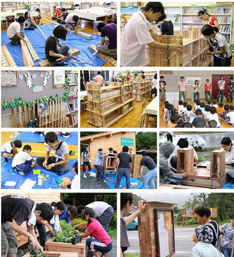
3.11生活復興支援プロジェクト

ToCollabo Tokai university Community linking Laboratory