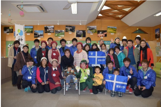
熊本地域プロデュース プロジェクト

ToCollabo Tokai university Community linking laboratory