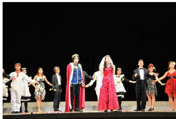
Music Art Project (MAP)