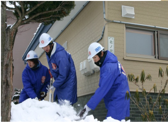
福祉除雪プロジェクト